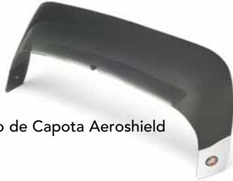
Escudo de Capota Aeroshield