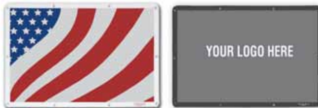
Maya contra Insectos